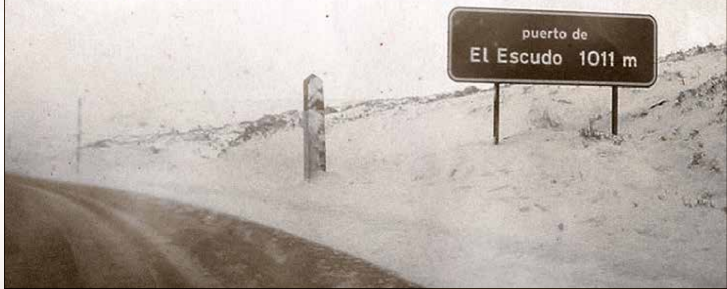
puerto de El Escudo 1011 m

Cada rincón invita a conocer una historia, en muchos casos personal o común, pero siempre con un trasfondo ligado al tráfico que atesoraba en otros tiempos este recorrido. Momentos que han quedado plasmados en el devenir gastronómico de las recetas que uno puede encontrar en sus restaurantes o en los detalles de sus edificaciones que cumplían funciones para asistir o albergar al viajante en cualquier momento o circunstancia. Todo ello, bajo el relato de sus habitantes que hace que el visitante pueda sorprenderse en cualquiera de sus paradas.